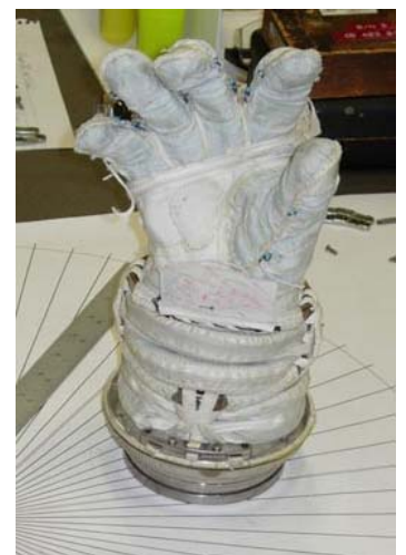
Guantes para astronautas

Más detalles en http://astronaut-glove.tripod.com (sitio disponible sólo en inglés).