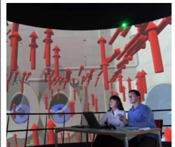
Los ingenieros que diseñan una planta de combustión usan un nuevo modelo de realidad virtual para estudiar la dirección en la cual los gases fluirán por su interior.