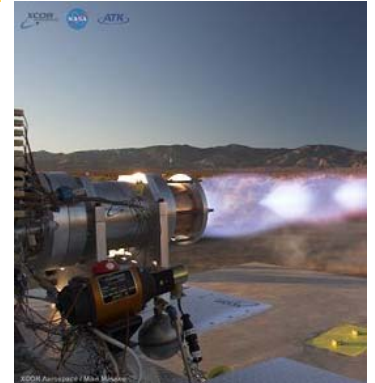
Testez la mise à feu des 7500 livres de poussée du moteur LOX/méthane.

maintenant les scientifiques et les ingénieurs développent des moteurs LOX/méthane comme option pour l'avenir. "Plusieurs efforts sont en cours, y compris un moteur rival LOX/méthane conçu par KT Engineering," note Tramel. Le méthane possède aussi la cote en ce qui a trait à la sûreté des personnes. Alors que quelques carburants de fusée sont potentiellement toxiques, "le méthane constitue ce que nous pouvons appeler un propulseur vert," dit Tramel. "Vous n'avez pas à mettre un habit spécial HAZMAT pour le manipuler comme les carburants utilisés sur beaucoup de véhicules spatiaux." Plus de détails se retrouvent à www.nasa.gov .