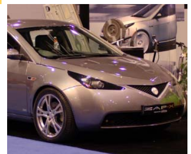
Le VUS électrique ZAP-X sera propulsé par un moteur électrique (voir partie droite supérieure) intégré dans chaque roue.

ZAP-X. La commande Hi-PA de PML intègre l'électronique du moteur et de l'entraînement dans une seule unité produisant une densité de puissance ultra élevée -- jusqu'à 20 fois plus que les systèmes conventionnels. La commande Hi-PA fournit un couple élevé dans un assemblage de moteur plat léger, idéalement conçu pour véhicule à roues commandées, où son impact sur la dynamique de suspension est minimal. Apprenez-en plus à www.pmlflightlink.com ou à www.zap.com .