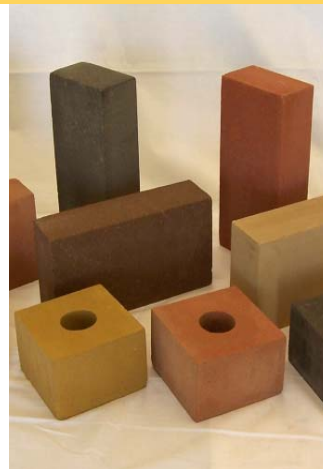
Les briques de cendres en suspension sont une alternative "verte" potentielle aux briques d'argile.

Liu, un professeur en génie civil retraité, travaille maintenant pour tester la sûreté du matériel composant la brique et pour la préparer pour le