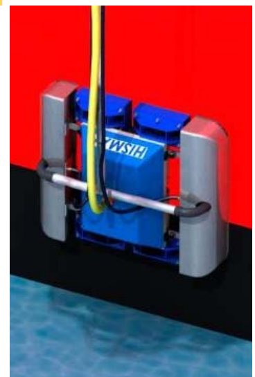
Robot HISMAR

pressurisés réglables enlèvent les concrétions marines de la surface du bateau qui sont alors aspirées vers le haut dans une chambre principale, où le matériel est filtré et le bio-encrassement est retiré et rendu inoffensif pour l'environnement local. De cette façon, l'aspirateur robotique à bateau se promène sans interruption sur la coque du bateau, empêchant l'accumulation de boue, amplifiant ainsi l'efficacité de son déplacement en réduisant la traînée. Plus d'information se retrouve à http://hismar.ncl.ac.uk .