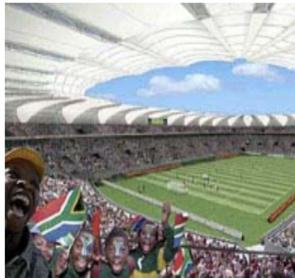
Impresión artística del estadio Nelson Mandela con capacidad para 50.000 personas, que se construirá en Puerto Elizabeth, Provincia Oriental del Cabo, para la Copa Mundial FIFA 2010

resultará ser muy llamativo, pues estará asentado en las laderas de la Montaña de la Mesa, mundialmente famosa por tener la cima plana. El recinto insignia del evento probablemente será el estadio Soccer City de Johannesburg, donde se realizarán la apertura y final del torneo. La sede del torneo de fútbol de Sudáfrica estará contenida dentro una distintiva estructura con forma de calabaza africana, y tendrá una capacidad para 94.700 personas cuando los trabajos de refacción hayan finalizado. El término de las obras de todos los estadios de la