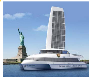
Sofisticado trasbordador híbrido eléctrico de Circle Line potenciado por energía solar y eólica, denominado "Miss Statue of Liberty" (Srta. Estatua de la Libertad).

Mayores detalles en www.solarsailor.com.au .