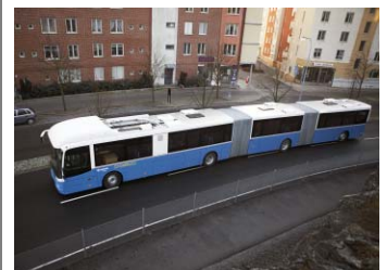
Volvo Buses es el principal proveedor mundial de vehículos para los modernos sistemas de autobuses de transporte rápido (Bus Rapid Transit, BRT). Una reciente entrega de 1.779 autobuses se efectuó al sistema BRT de Santiago, Chile.