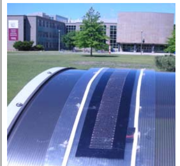
Vista exterior de una banda solar flexible, en el techo arqueado que cobija una parada de autobuses, diseñada por investigadores de ingeniería en la Universidad de McMaster.