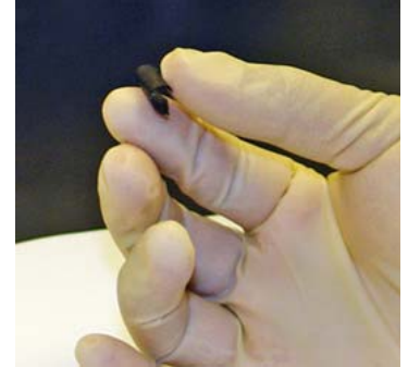
El nuevo papel de nanocompuesto creado por ingenieros e investigadores del Rensselaer Polytechnic Institute está impregnado con nanotubos de carbono.

dispositivos de almacenamiento conduzcan electricidad. El dispositivo, diseñado para funcionar como batería de ion de litio además de como supercondensador, puede brindar una potencia duradera y estable, comparable a la de una batería convencional, y también generar la ráfaga de alto volumen energético característica de un supercondensador. El dispositivo se puede enrollar, torcer, plegar o cortar en cualquier cantidad de formas sin que pierda su integridad o eficacia mecánica. Las baterías de papel también se pueden apilar para aumentar la generación energética total. En www.rpi.edu aparecen más detalles al respecto (sitio disponible sólo en inglés).