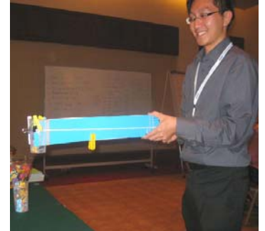
Prueba de brazos robotizados en un taller reciente para maestros en servicio patrocinado por IEEE, realizado en Malasia.

Descubra ésta y otras lecciones en línea en www.tryengineering.org/lesson.php .