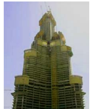
El Burj Dubai contendrá la instalación del ascensor más alto del mundo.

máximo piso habitado, la altura del techo y la del pináculo. El proyecto Burj Dubai comenzó en 2004 como parte de una urbanización de US$20 mil millones y 200 hectáreas catalogada como el kilómetro cuadrado más prestigioso del mundo. Diseñada por Skidmore, Owings and Merrill de Chicago, Illinois, EE.UU., la torre está siendo construida por Samsung Corp. de Corea del Sur. En www.burjdubai.com aparecen más detalles al respecto (sitio disponible sólo en inglés).