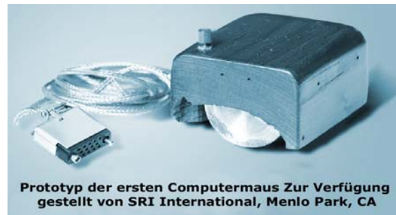
Prototyp der ersten Computermaus