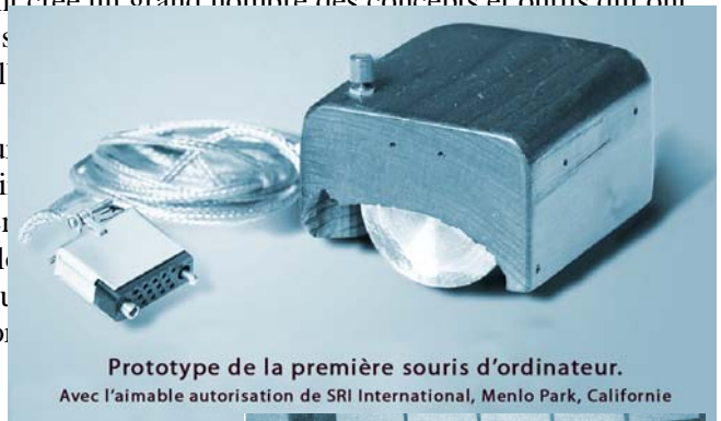
Prototype de la première souris d'ordinateur.

Dr Douglas C. Engelbart et son équipe à SRI International ont créé un grand nombre des concepts et outils qui ont déclenché la révolution informatique mondiale. La première souris d'ordinateur est une innovation marquante qui ont vu le jour à SRI. Doug Engelbart est l'inventeur de la souris qu'il explorait les interactions entre l'homme et l'ordinateur. Le premier prototype en 1964. La première souris d'ordinateur avait un seul bouton rouge. Des modèles dotés de plusieurs boutons fonctionnels ou une paire de roulettes était utilisée pour traduire le mouvement de la souris sur l'écran. Doug Engelbart était l'inventeur du brevet de base appelé « Y pour système d'affichage ». Dr Engelbart considérait la souris comme un objet bien plus vaste dont l'objet était de faciliter l'apprentissage et la communication mondiale.